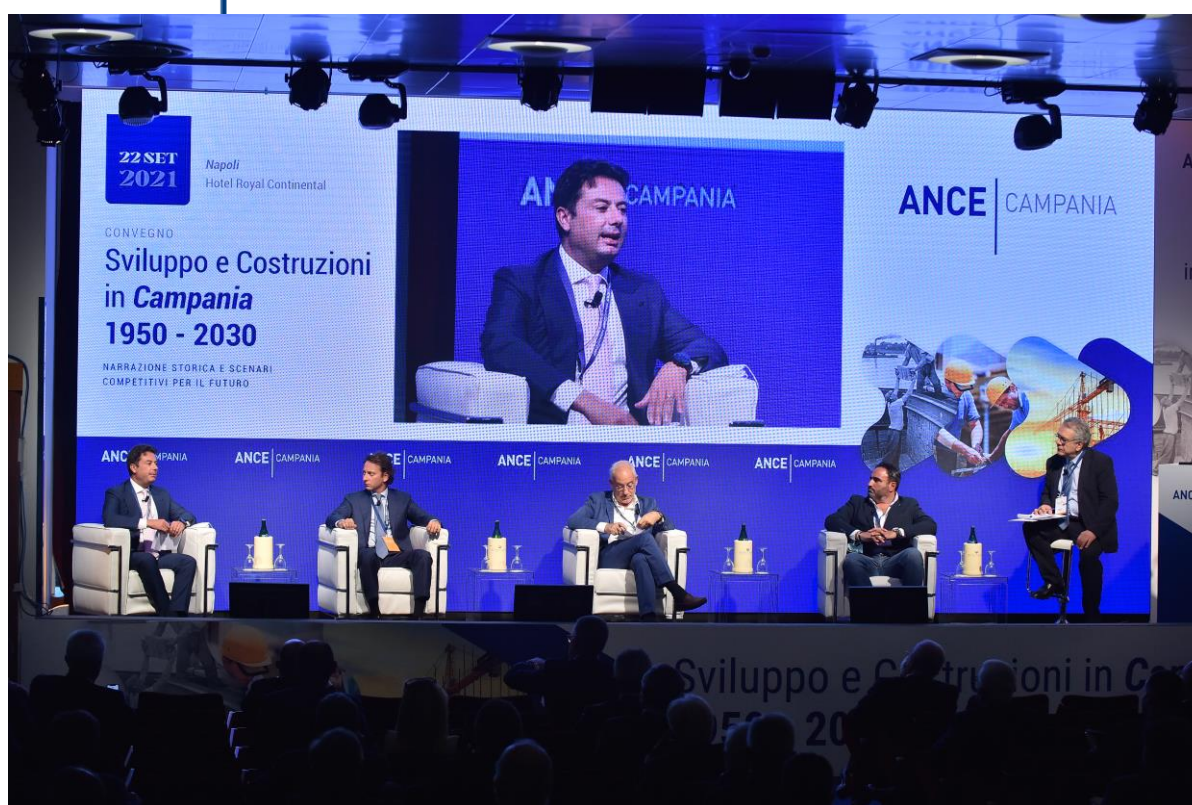
ANCE Campania – convegno del 22 settembre 2021