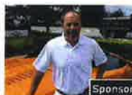
Come sono diventati milionario con 25000€ di entrate l'anno