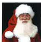
Muore tra le braccia di Babbo Natale, ultimo desiderio di un bimbo - Mondo