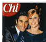
Ennesima crisi tra Magnini e Pellegrini. Il nuotatore: "Perché è finita?"