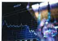
Moody's taglia outlook banche Italia - Economia